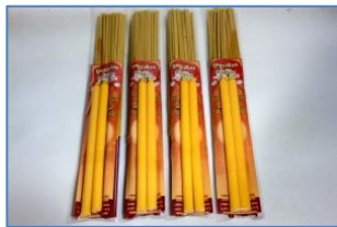
รูปเทียน